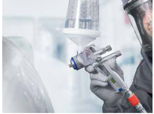
Yhdenmukainen ja joustavasti säädeltävä ruiskutuskuvio erityisvaatimuksiin - SATAjet 5000 B täydelliseen lopputulokseen