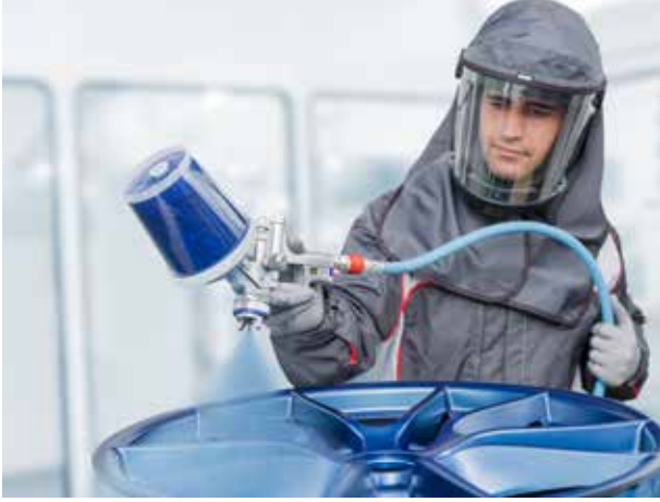
Edistyksellinen ergonomia - SATAjet 5000 B ruiskun optimoitu kahva sopii jokaiseen käteen