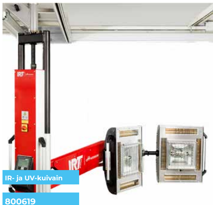
IR- ja UV-kuivain