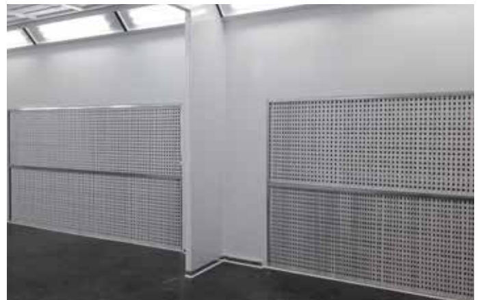
Teollisuusmaalaus sivuseinämulla - tarpeen mukaan eri suodatusratkaisut