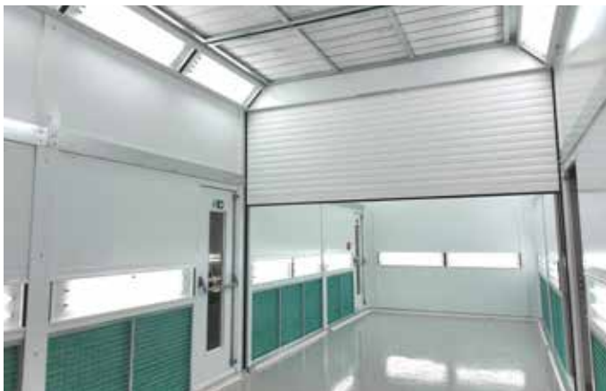
Teollisuusmaalaus seinämulla ja tilat jakava nosto-ovi - tilojen käyttö energia- ja tuotantotehokkaasti