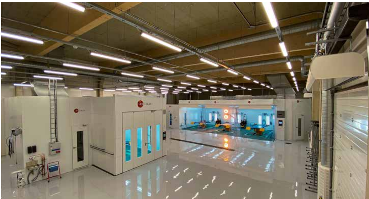
Nykyaikaisen vauriokorjaamon maalaamo - maalausammio, sekoitus- ja ruiskunpesuhuoneet sekä esikäsittelytila