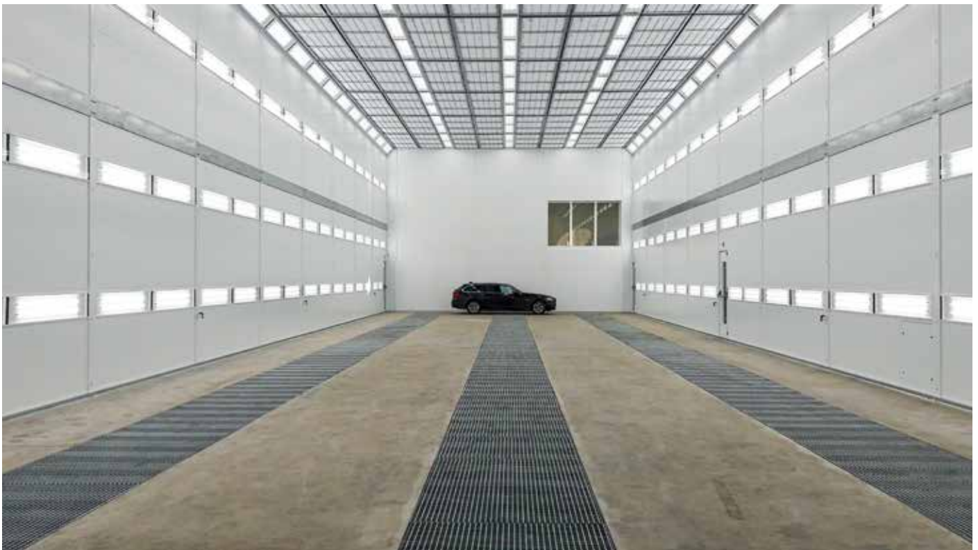
Teollisen valmistuksen pintamaalausratkaisut – suurille tai pienille pinta-aloille laadusta ja suorituskyvystä tinkimättä